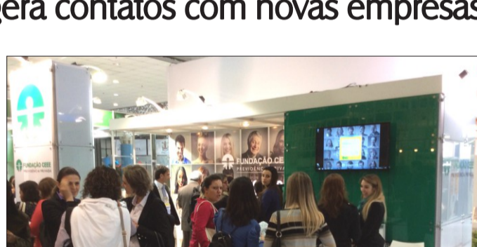
Entidade investe em feiras para estabelecer novos negócios.

Centenas de profissionais visitaram o estande da Fundação CEEE na Expocongregarh 2015, feira vinculada ao congresso de gestão de pessoas organizado pela seccional gaúcha da Associação Brasileira de Recursos Humanos (ABRH-RS), realizado de 13 a 15 de maio, em Porto Alegre. Entre os visitantes, executivos de empresas interessadas em oferecer planos de previdência para seus colaboradores. Pelo menos, 20 empresas se manifestaram nos contatos estabelecidos durante o evento. Isso demonstra o potencial da Expocongregarh como uma excelente oportunidade para a Fundação CEEE se conectar com o mercado, difundir a sua marca como uma entidade aberta para a adesão de novas patrocinadoras e gerar novos negócios para o seu crescimento institucional. Durante o evento, a Fundação organizou jogos interativos sobre previdência e demografia e disponibilizou um simulador de capitalização em planos de aposentadoria para os visitantes terem uma ideia da importância da previdência complementar como fonte de poupança de longo prazo. Além disso, a Fundação também organizou uma palestra sobre poupança, consumo e a necessidade cada vez maior de reservar recursos para o futuro. A palestra atraiu um bom público, o que demonstra a preocupação e o interesse das pessoas ao tema.