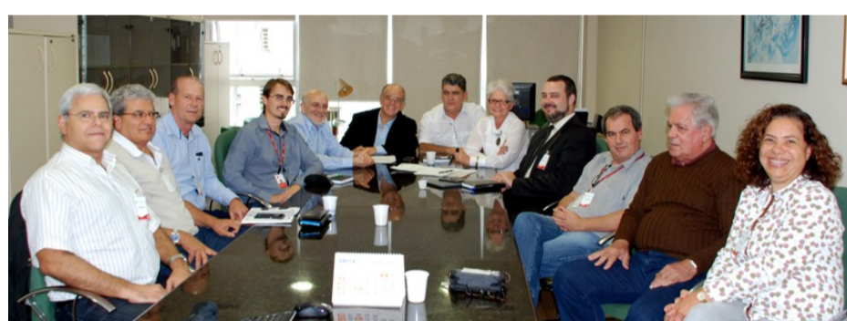
Encontro reuniu Diretoria da Fundação e representantes de cinco entidades.

No dia 25 de maio, a Diretoria Executiva da Fundação CEEE recebeu representantes da ACEEEE, UNIPROCEEE, ATCEEE, AFCEEE e ADVCEEE, atendendo a uma iniciativa das entidades representativas dos empregados das companhias de energia. Na oportunidade, a Fundação abriu um novo espaço para o relacionamento com as entidades, debateu questões pertinentes à administração dos planos previdenciários, bem como o relacionamento com suas patrocinadoras e instituidores. A Diretoria da Fundação CEEE, que prima pela participação e transparência, cumprimenta as entidades pela iniciativa.